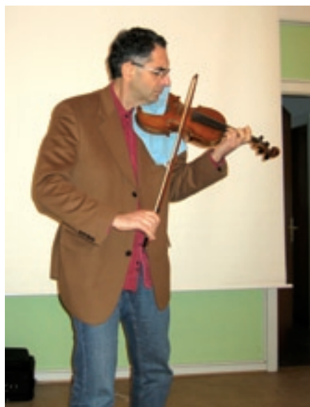
Den armenske violinist spiller eftertænksomt armensk musik