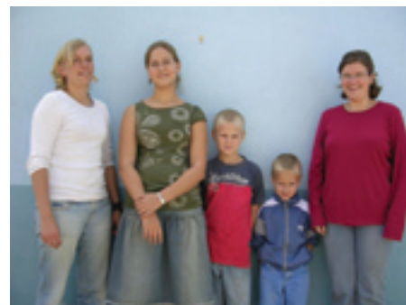
Med en elev i 7., en i 3. og den yngste i børnehaveklasse var der til sidst brug for to lærere for at kunne undervise i alle fag, da de faglige spring var meget store. Her står vi på skolens sidste dag i 2007.