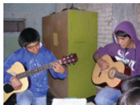
Musikere er der brug for i menighederne. Her ses to unge, der lige er begyndt at spille guitar.