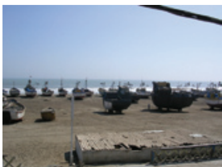
Chiclayo ligger 15 km fra Stillehavet. Her ses fiskerbåde næsten klar til afgang.