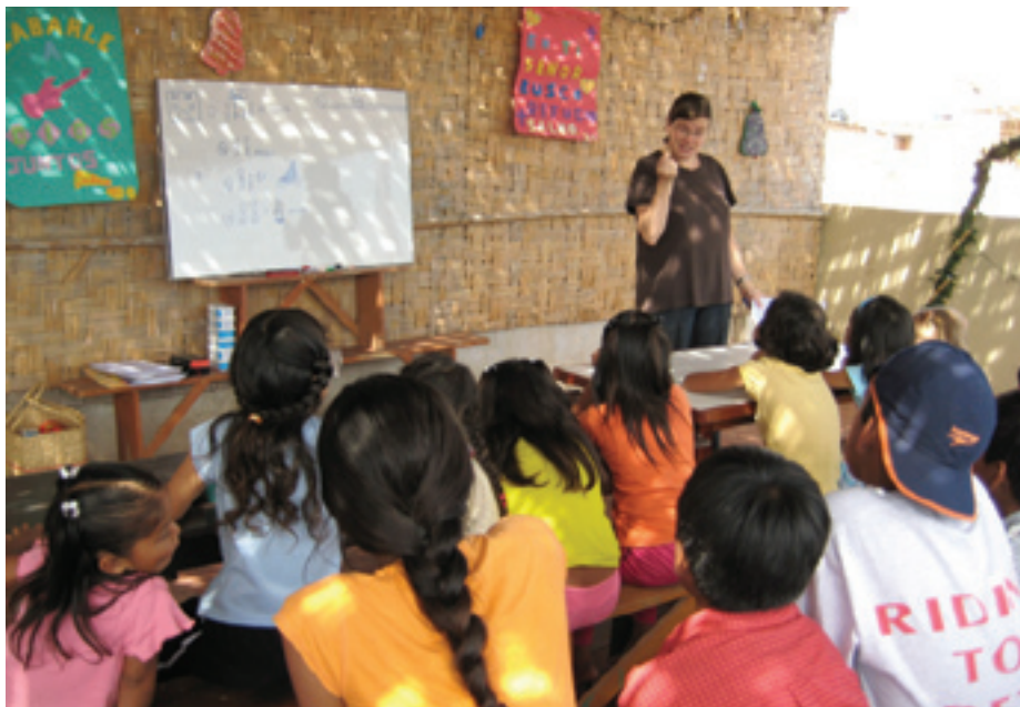
Undervisning i menighederne blev en anden del af mit arbejde. Her ses en samling til det årlige bibelkursus for både børn og voksne.

En sandsynligvis dejlig dag sidst på eftermiddagen blev jeg for godt 36 år siden født på Viborg sygehus, hvorefter jeg fragtedes til en gård tæt ved Bjerringbro, hvor jeg boede i både skole- og gymnasietid sammen med forældre og to søskende. Efter et par år med andre aktiviteter gik turen til Aalborg for at læse på lærerseminariet med linjefagene historie og musik, for derefter at arbejde fire år på Vester Mariendal Skole i samme by. I denne periode påbegyndtes samtalerne om en fremtidig tjeneste som missionær for Evangelisk Luthersk Mission (ELM). Der var behov for en uddannet lærer til først to senere tre missionærbørn, så til min store glæde kunne det at være lærer forenes med det at være missionær. Som et led i forberedelsen drog jeg til København for at læse et år på den TværKulturelle Missionsuddannelse, hvorefter turen gik til Peru i august 2004. Peru – et fantastisk flot land med både jungle, bjerge og ørken helt ud til Stillehavet. Et land med stor forskel på rig og fattig. Et land hvor man spiser fantastisk mad. Et land som nu næsten er mit andet hjemland.