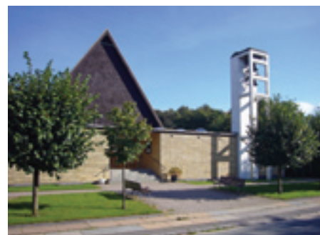
Emdrup Kirke i dag.

I et bysogn bor mange mennesker kun få år, før de flytter videre. Jeg har mødt mange mennesker i hele landet, som i få eller mange år har kommet i den lille gule kirke nede ved mosen, og som omtaler det med stor taknemmelighed.