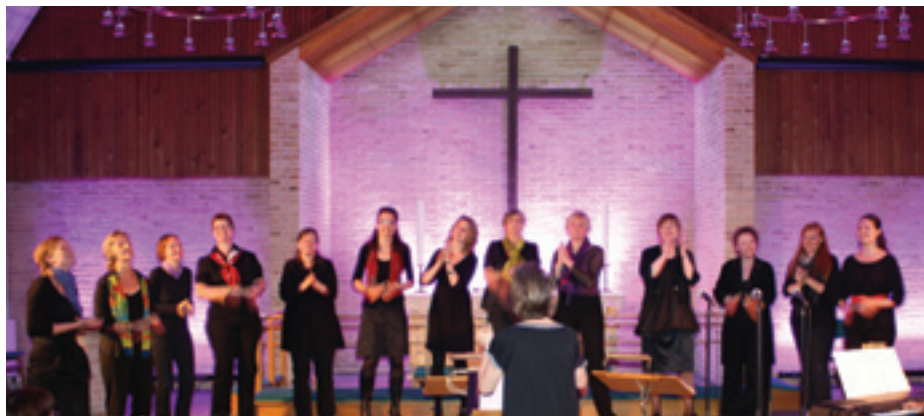
Fra forårskoncerten 25. maj. EKKO med band.

Det er nu tid til at tage hul på en ny sæson i koret EKKO og en god anledning for nye sangglade piger/damer til at begynde i koret.