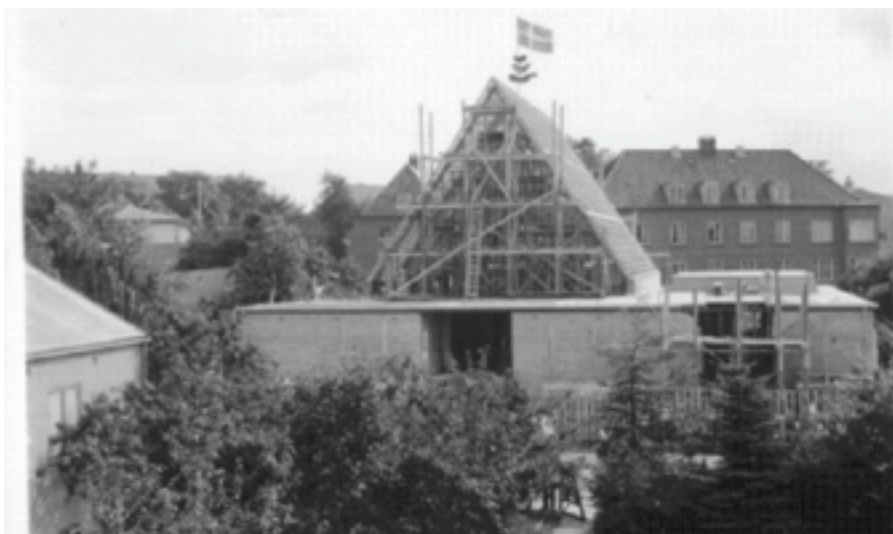
Rejsning af Emdrup Kirke.

I 1946 blev Emdrup sogn udskilt fra det store Bispebjerg nabosogn. De første 15 år holdt man gudstjeneste i Barakkirken i KFUM-parken. Barakken står der endnu. Lidt indeklemt mellem den store hal og tennisbanerne. Men målet var at få en egnet kirkebygning, og gennem 15 års imponerende indsats på græsrodsplan lykkedes det at samle ind til byggegrund og kirkebygning på adressen Ved Vigen tæt på Utterslev mose. I dag finansieres kirkebygningen gennem kirkeskatten, men dengang krævede det en folkelig opbakning fra hundredevis af lokale beboere. Opfindsomheden og offerviljen var stor, når det gjaldt om at skaffe penge til kirkeprojektet, og derved lykkedes det at rejse ikke blot en kirkebygning, men også en stor kælder og dagligstue og mødelokale ved siden